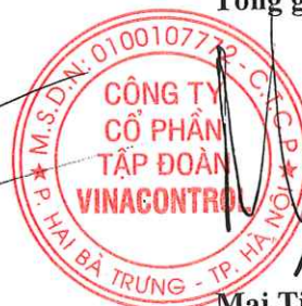
Mai Tiến Dũng