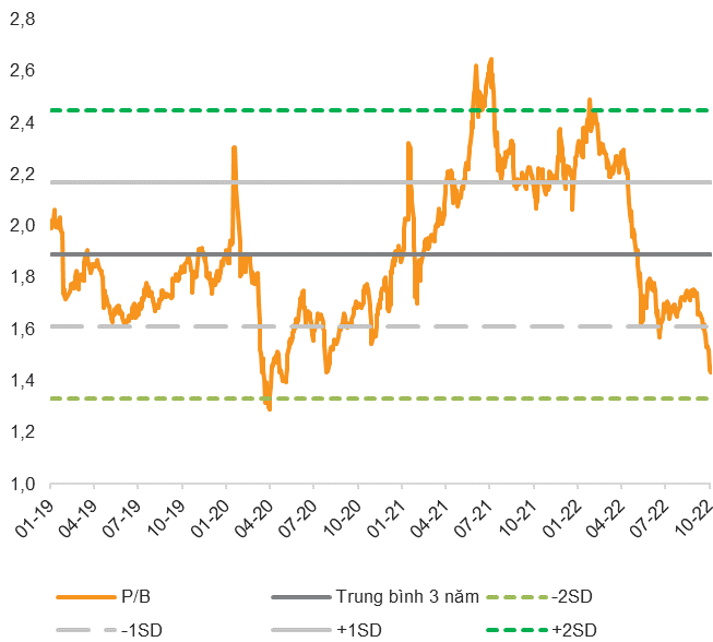
Hình 2: P/B hiện tại đang dao động dưới mức -1 độ lệch chuẩn; và P/B dự phóng năm 2022 đang ở mức chỉ 1,1 lần