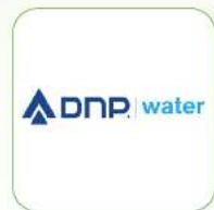
CTCP Đầu tư Ngành nước DNP