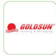
CTCP In và Bao bì Goldsun